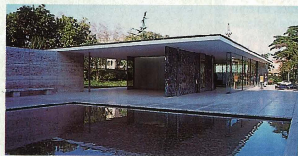
Pabellón alemán en la Exposición Internacional de 1929, de Mies van der Rohe, reconstruido en 1980