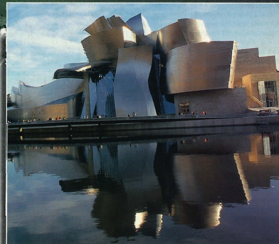
El pueblo de Vegaviana, en Cáceres, y el Museo Guggenheim, en Bilbao, dos formas de entender la arquitectura. Cada una en su tiempo fueron rompedoras y son reconocidas por todos los expertos

Años más tarde, en 1990, el alcalde sacó un bando para que los vecinos tomaran ➤