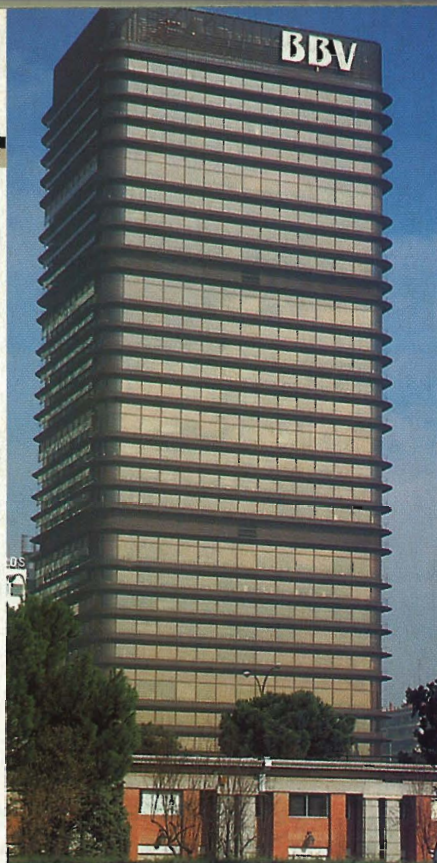
El Banco de Bilbao, hoy BBV, y el Palacio de Congresos y Exposiciones de Salamanca, entre las mejores obras

➤ En la provincia de Barcelona se encuentran dos de las obras emblemáticas de la arquitectura de este siglo y ambas realizadas por el tándem Coderch/Valls: el edificio de Apartamentos en la Barceloneta o Casa de la Marina, y la Casa Ugalde, en Caldes d'Estrac. Ésta es, según los expertos, "uno de los ejemplos más claros y un importante signo del renacimiento de la arquitectura moderna tras los oscuros años del academicismo impuesto por el régimen de la posguerra". La Casa Ugalde, fotografiada hasta la saciedad por Catalá-Roca, fotografía clave para la arquitectura catalana de los 50 y recientemente fallecido, ha sido adquirida por la familia Amat, propietaria de la tiendas Vinçon de Barcelona y Madrid.