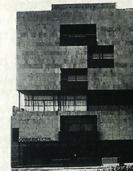
La sede del gobierno civil de Tarragona fue hecha en el franquismo