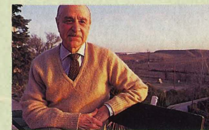
Miguel Ángel Fisac

Una de sus obras maestras en el arte de edificar iglesias -que cultivó con especial intensidad y acierto- es el Colegio Apostólico